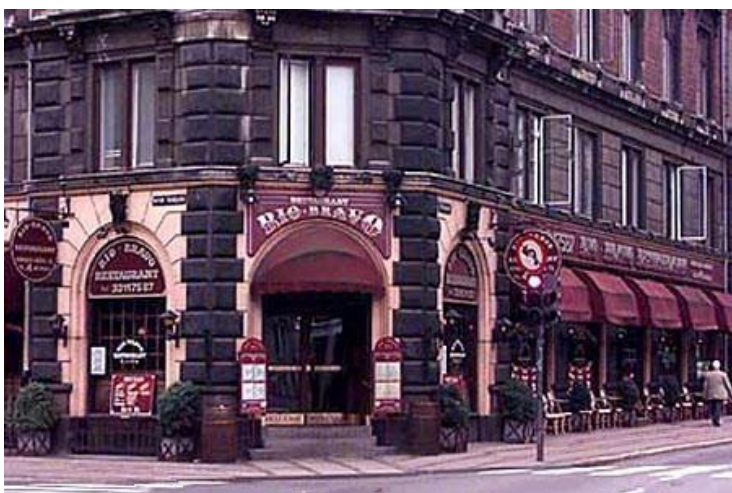
Restaurant Rio Bravo

Hvis vi undslipper spiser vi frokost: Stegt flæsk og persillesovs på