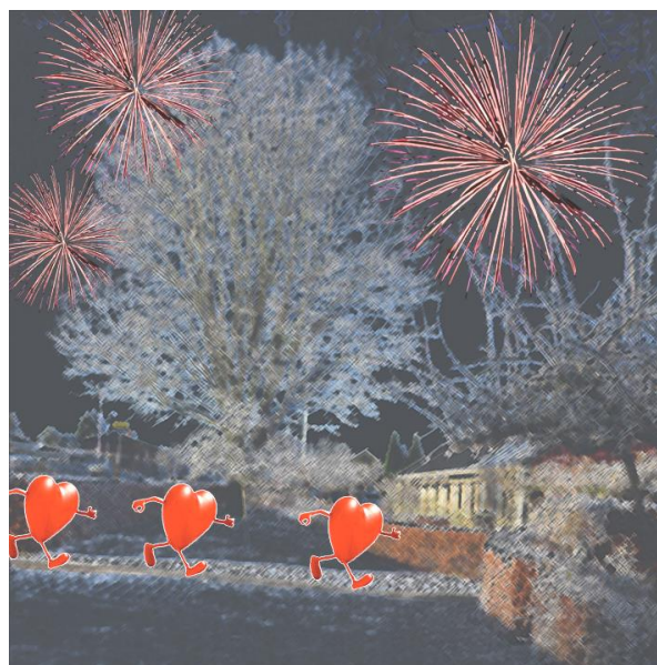
Foto: Hjerter i løb mod Gedevassevang på vej til Pusterummet.